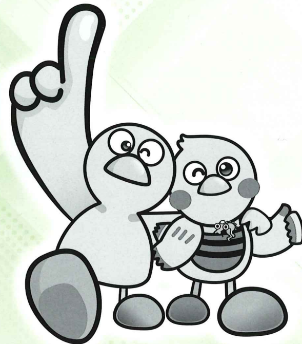
埼玉県のマスコット「コバトン」・「さいたまっち」